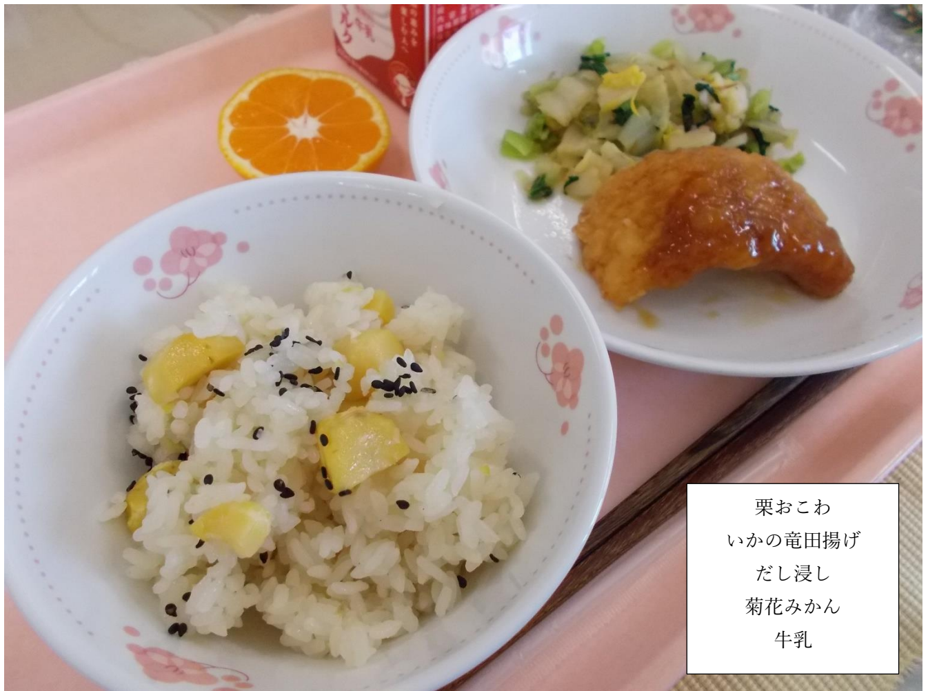
栗おこわ いかの竜田揚げ だし浸し 菊花みかん 牛乳