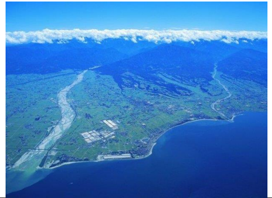
とやまわん 富山湾 さかな たくさんの魚がすんでいます。