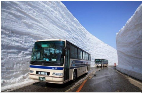
立山黒部アルペンルート 高さ20メートルの雪のかべ。