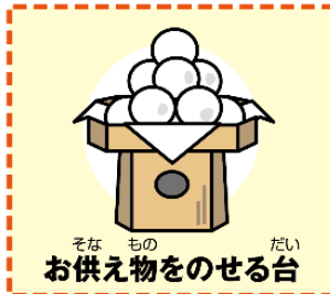
お供え物をのせる台