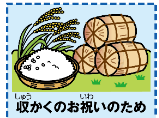
収かくのお祝いのため