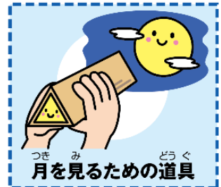
月を見るための道具