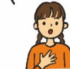
ねんぐみ なまえ い 年組名前を言う