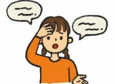
きりゆう い 来た理由を言う