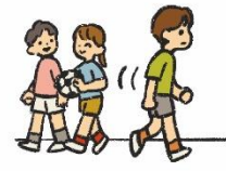
なるべくやす なるべく休み時間に来る