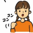
あいさつして入る