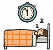
やす 休めるのは1時間まで