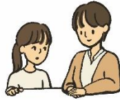
なやみのそうだん