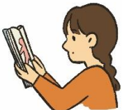
こころ からだ し 心や体を知る